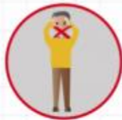
РАК ГУБЫ, ЯЗЫКА