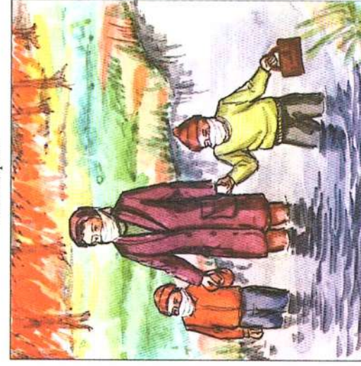
В экстремальных случаях выходить придётся не только по дорогам, а чаще вдоль рек, ручьёв и непосредственно по воде