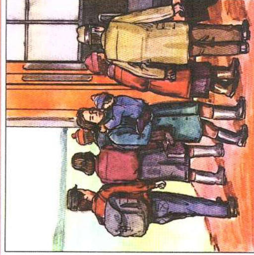
При приближении огня к населённому пункту жителей необходимо эвакуировать