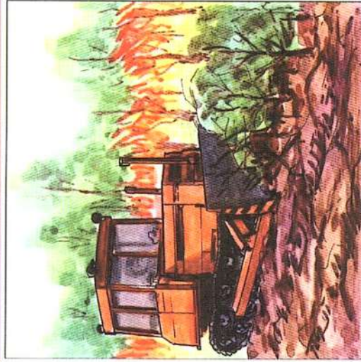
Для прекращения распространения огня следует устраивать земляные полосы