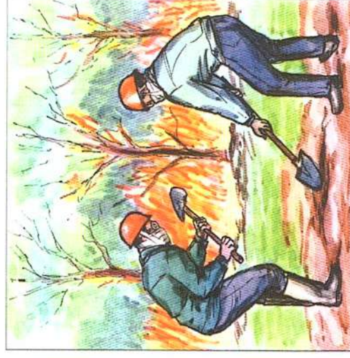
Забрасывание огня рыльцем грунтом повышает эффективность борьбы с пожаром